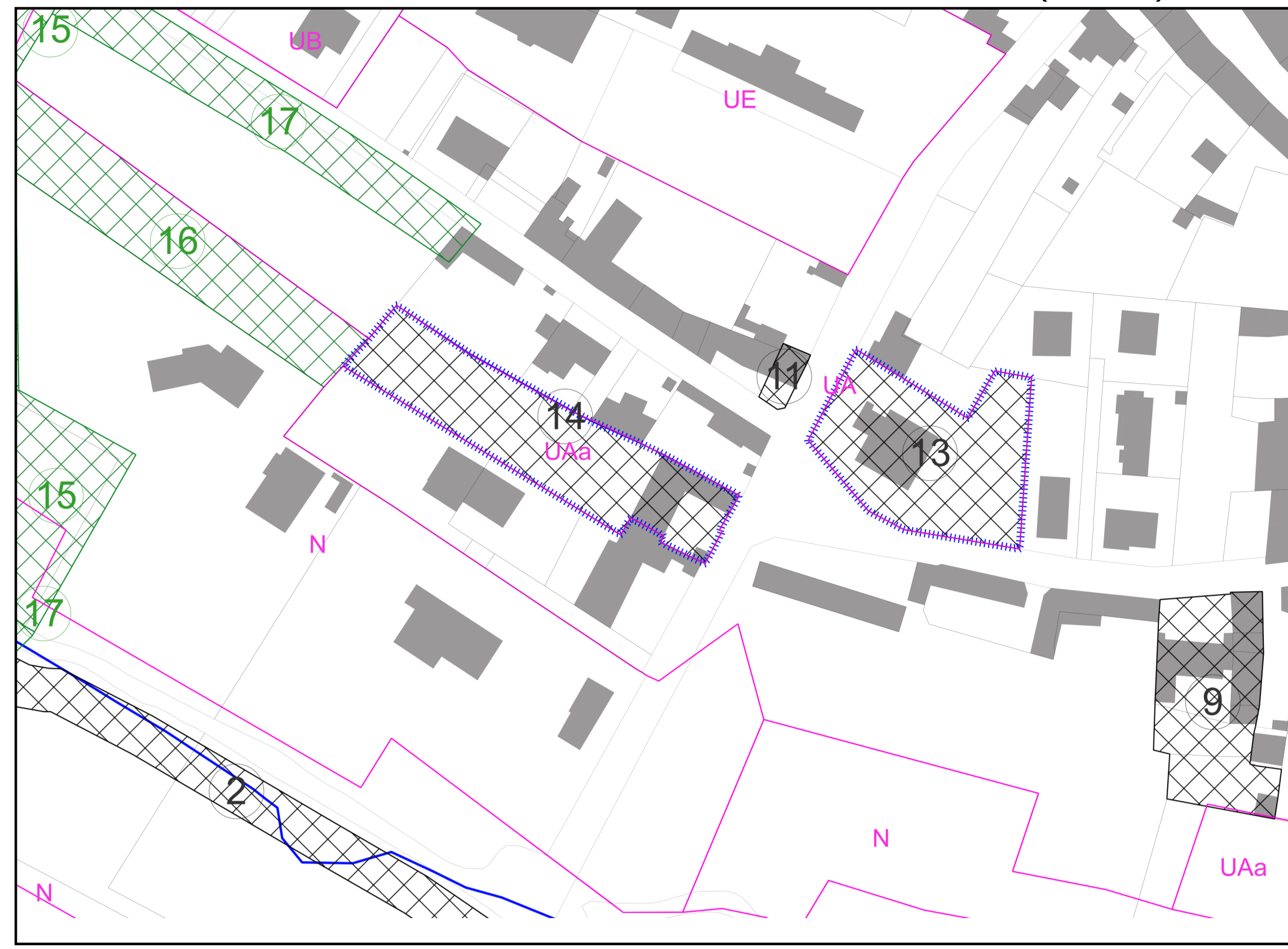
Tableau des emplacements réservés