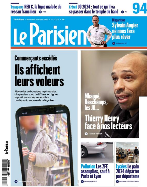
Extrait Le Parisien 94 n°24748 – 20 mars 2024

Une annonce légale est parue le 20 mars 2024 dans Le Parisien 94 n°24748 dans le but d'annoncer qu'une procédure de modification est lancée.