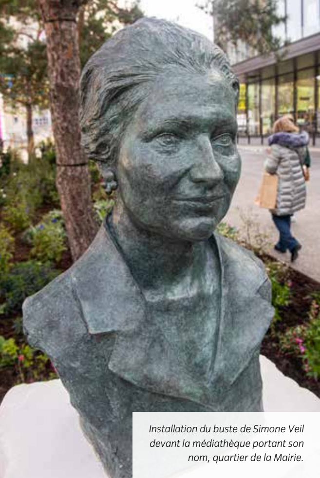
Installation du buste de Simone Veil devant la médiathèque portant son nom, quartier de la Mairie.