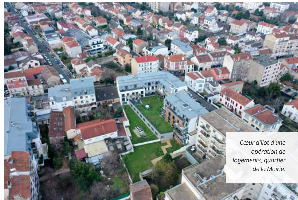
Cœur d'îlot d'une opération de logements, quartier de la Mairie.

Au cœur de la ville, la nature joue un rôle primordial dans la perception de la densité. Outre le PLU qui doit viser au développement de plus d'espaces verts et notamment au cœur des nouvelles opérations, il semble nécessaire de renforcer l'emprise de cette nature tout en valorisant les espaces verts existants.