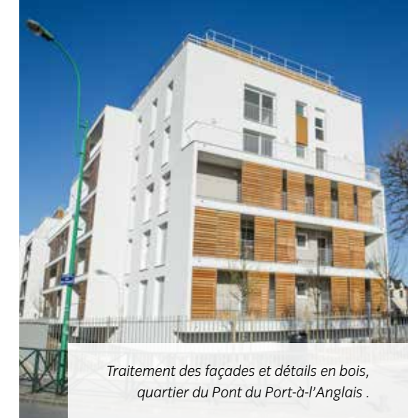
Traitement des façades et détails en bois, quartier du Pont du Port-à-l'Anglais.

Il est donc demandé de traiter qualitativement la façade des rez-de-chaussée lorsqu'ils proposent des parkings en tenant compte du paysage urbain dans lequel ils s'inscrivent, et d'animer l'espace