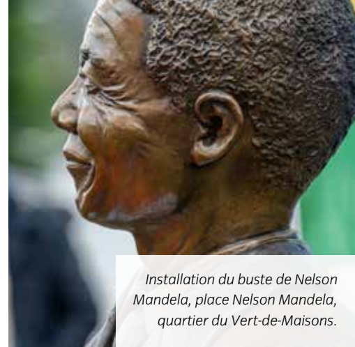
Installation du buste de Nelson Mandela, place Nelson Mandela, quartier du Vert-de-Maisons.

Lorsque qu'une opération comporte un rez-de-chaussée commercial, il est demandé de mener une réflexion sur la nature d'activité à implanter pour maintenir ou développer la mixité fonctionnelle du quartier.