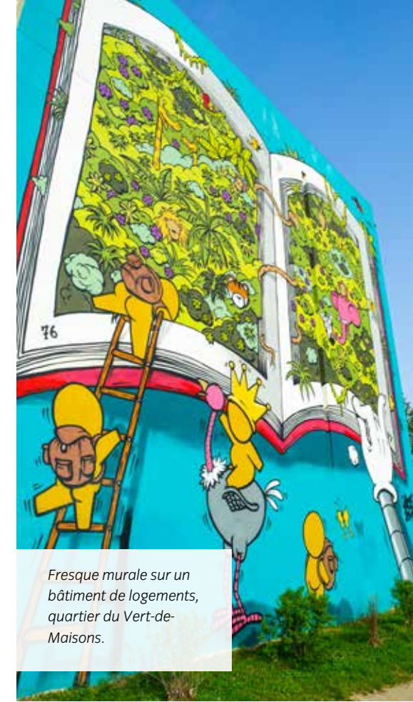
Fresque murale sur un bâtiment de logements, quartier du Vert-de-Maisons.

Il s'agit avant tout de rendre l'Art accessible à tous. Il est également demandé de promouvoir la préservation et la reconversion patrimoniale.