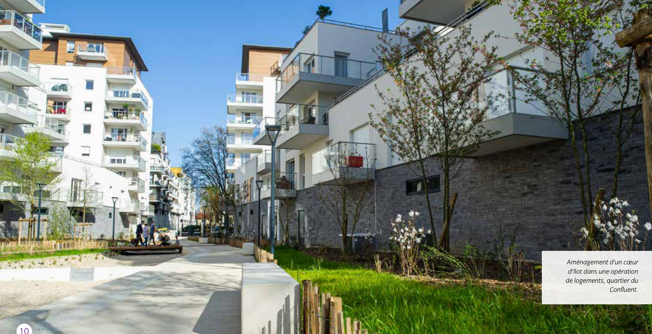
Aménagement d'un cœur d'îlot dans une opération de logements, quartier du Confluent.

Pour comparaison à la fin de l'année 2007, la surface d'espaces verts était de 13.6 hectares.