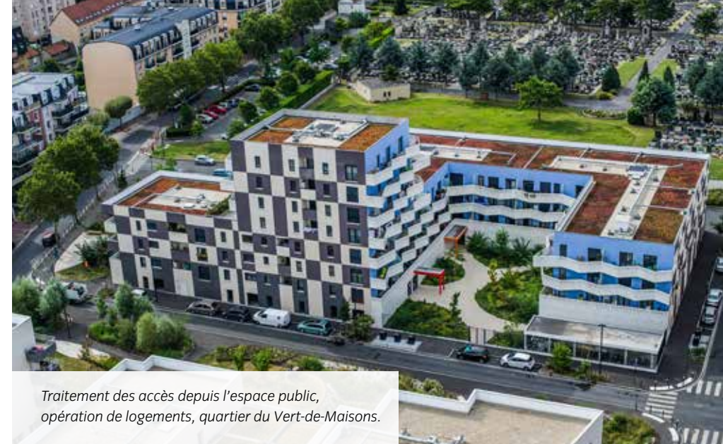
Traitement des accès depuis l'espace public, opération de logements, quartier du Vert-de-Maisons.

Les locaux poussettes et/ou vélos devront être facilement accessibles depuis la voie publique. Ces derniers devront être équipés d'attaches vélos et poussettes en distinguant les deux. Enfin, dans le cas d'opérations d'ampleur, il est demandé d'étudier la possibilité d'aménager plusieurs locaux en fonction du nombre de cages d'escaliers créées. Une localisation en rez-de-chaussée,