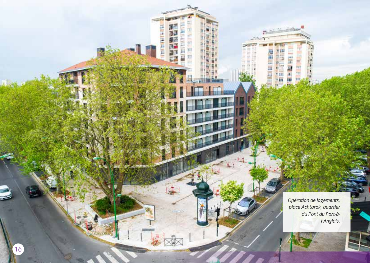
Opération de logements, place Acharak, quartier du Pont du Port-à- l'Anglais.