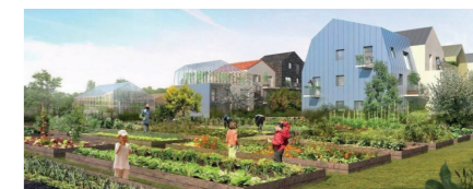
© agence Po & Po, site de Morangis en Essonne

Par le développement d'une offre d'habitat diversifiée, intégrée au paysage et à taille humaine permettant d'accueillir les habitants dans un cadre agréable.