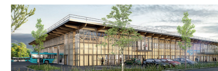
Dépôt des bus des transports urbains, Saint-Brieuc, France Architecte: DLW Architectes © DLW Architectes

En implantant en partenariat avec Ile de France Mobilités un centre-bus nouvelle génération accueillant des bus roulant aux énergies naturelles.