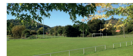
Terrain multisports, site de Nauviale.

Espaces de transition entre les milieux urbains et agricoles, des terrains sportifs de plein air permettront de répondre aux besoins des associations et des scolaires.