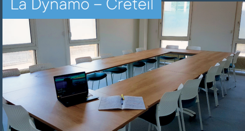
La Dynamo – Créteil

94, avenue du Général-de-Gaulle – 94000 Créteil