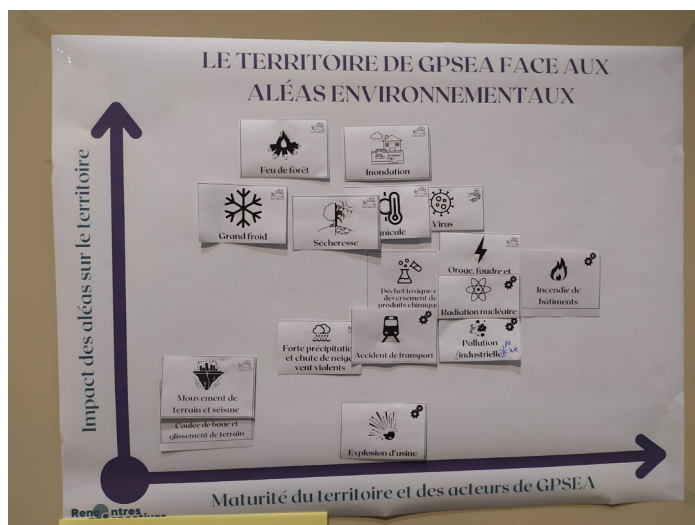
Exemple de Matrice des vulnérabilités (groupe jaune)

DM COMPOST, Veolia eau, Territoire Paris Métropole, Ville de Sucy-en-Brie, Médiathèques d'Alfortville, Ville de Créteil, HAROPA PORT, Au fil de l'eau, Ville de Villecresnes, Office National des Forêts, Orange, Medef, WALTER (We Are for Low Tech & Environment Restoration), France assureurs, Futuribles, Chambre de Commerce et Industrie Paris Val-de-Marne, club d'entreprises CECAP, Ville de Boissy-St-Léger et des membres du Conseil prospectif de Grand Paris Sud Est Avenir.