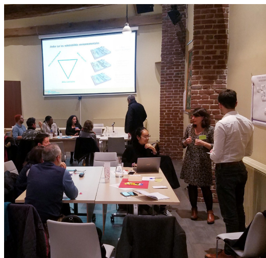
Les groupes rouge et bleu en pleine séance collective