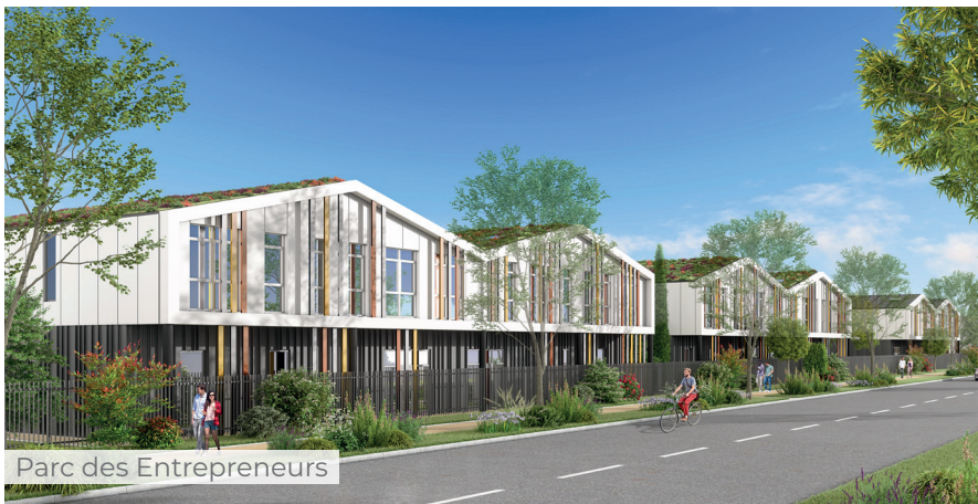
Parc des Entrepreneurs