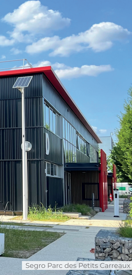
Segro Parc des Petits Carreaux