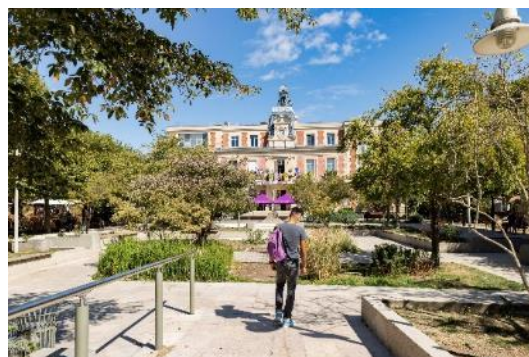
Parvis de la Mairie d'Alfortville