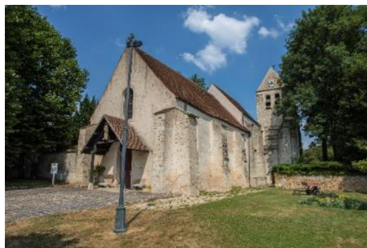
L'église de Marolles-en-Brie