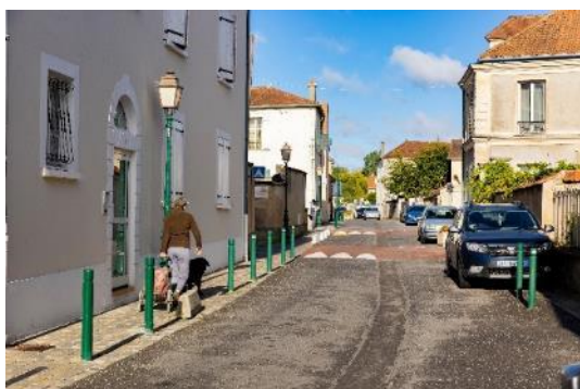
Vieux village de Périgny-sur-Yerres