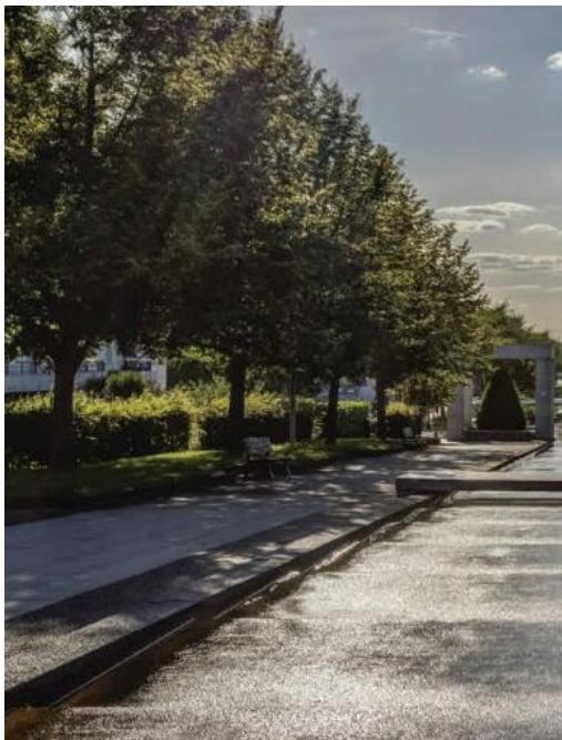
Quartier de la Source à Créteil