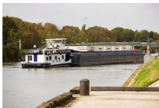
Port et zone d'activités économiques à Bonneuil-sur-Marne