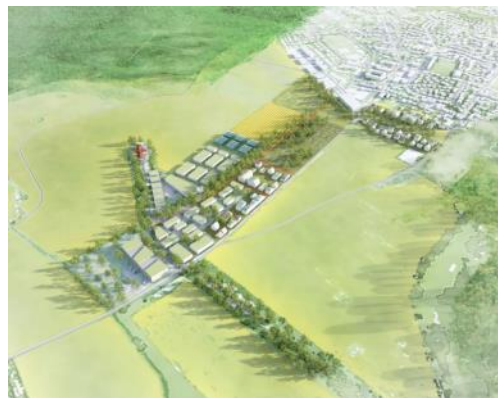
Illustration possible du futur agro-quartier de Noiseau