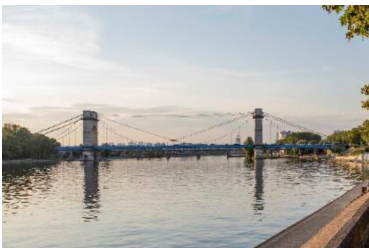
La Seine à Alfortville