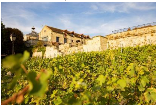
Les terrasses de vignes de Chennevières-sur-Marne