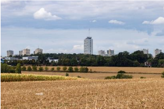
Plaine agricole de Noisseau