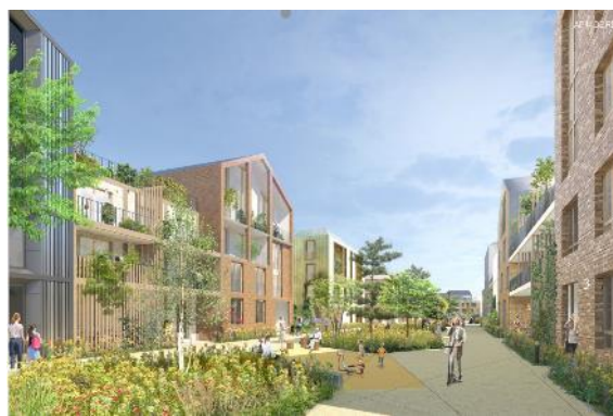
Illustration possible de la future ZAC de la Plaine des Cantoux d'Ormesson sur Marne