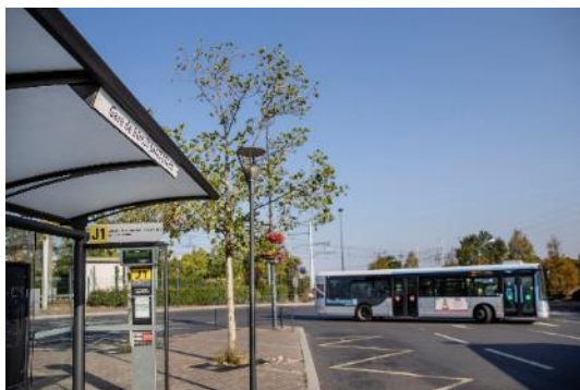
Arrêt de bus à Boissy-Saint-Léger