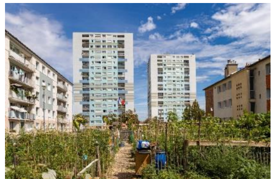
Agriculture urbaine à Bonneuil-sur-Marne