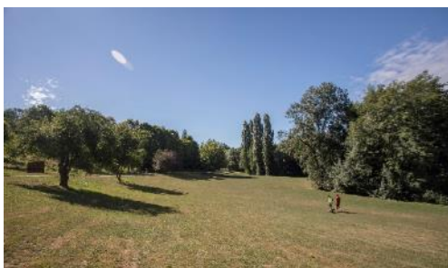
Parc du Morbras à Ormesson-sur-Marne