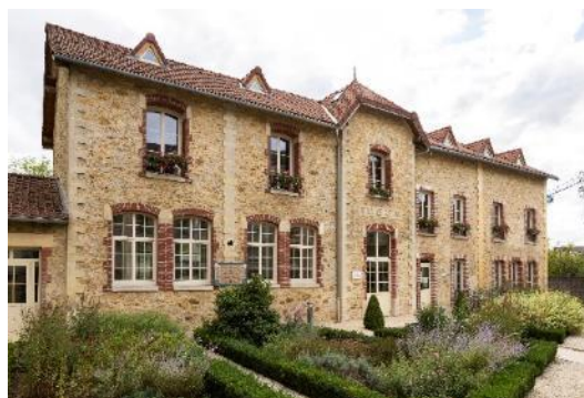
L'espace Georges Roussillon au Plessis-Trévisé