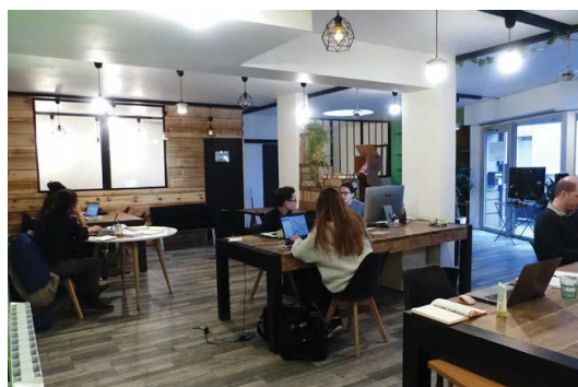
Coworkcity à Alfortville