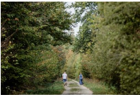
Forêt Notre-Dame à Sucy-en-Brie