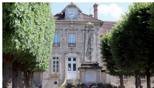
Médiathèque-bibliothèque de Mandres-les-Roses