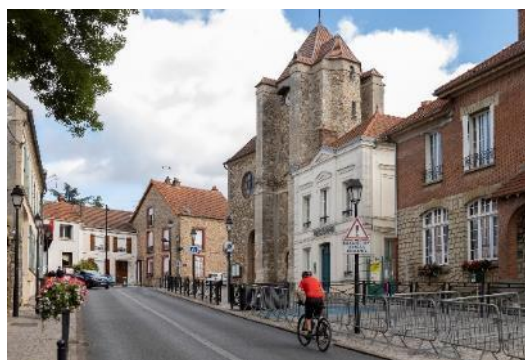
Centre ancien de la Queue-en-Brie