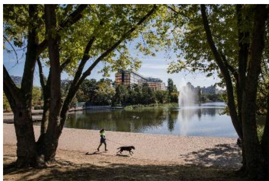
Rives du lac de Créteil