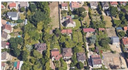
Quartier pavillonnaire Boissy Saint Léger