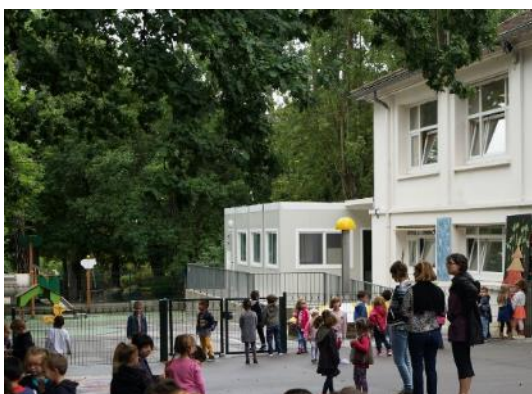
L'école maternelle du Parc du Château à Villecresnes.